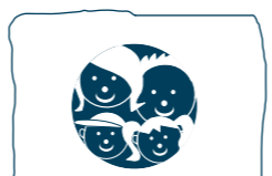
Tableau Noir Eine Zwergenschule in den Bergen